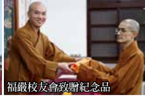
福嚴校友會致贈紀念品